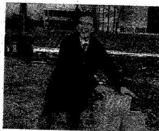
Da sinistra Diego Bottacin con Piero Fassino Nel 2005 al cantiere del campo di rugby di Mogliano e in bicicletta, una delle sue passioni