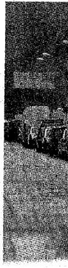
Traffico lungo l'ane